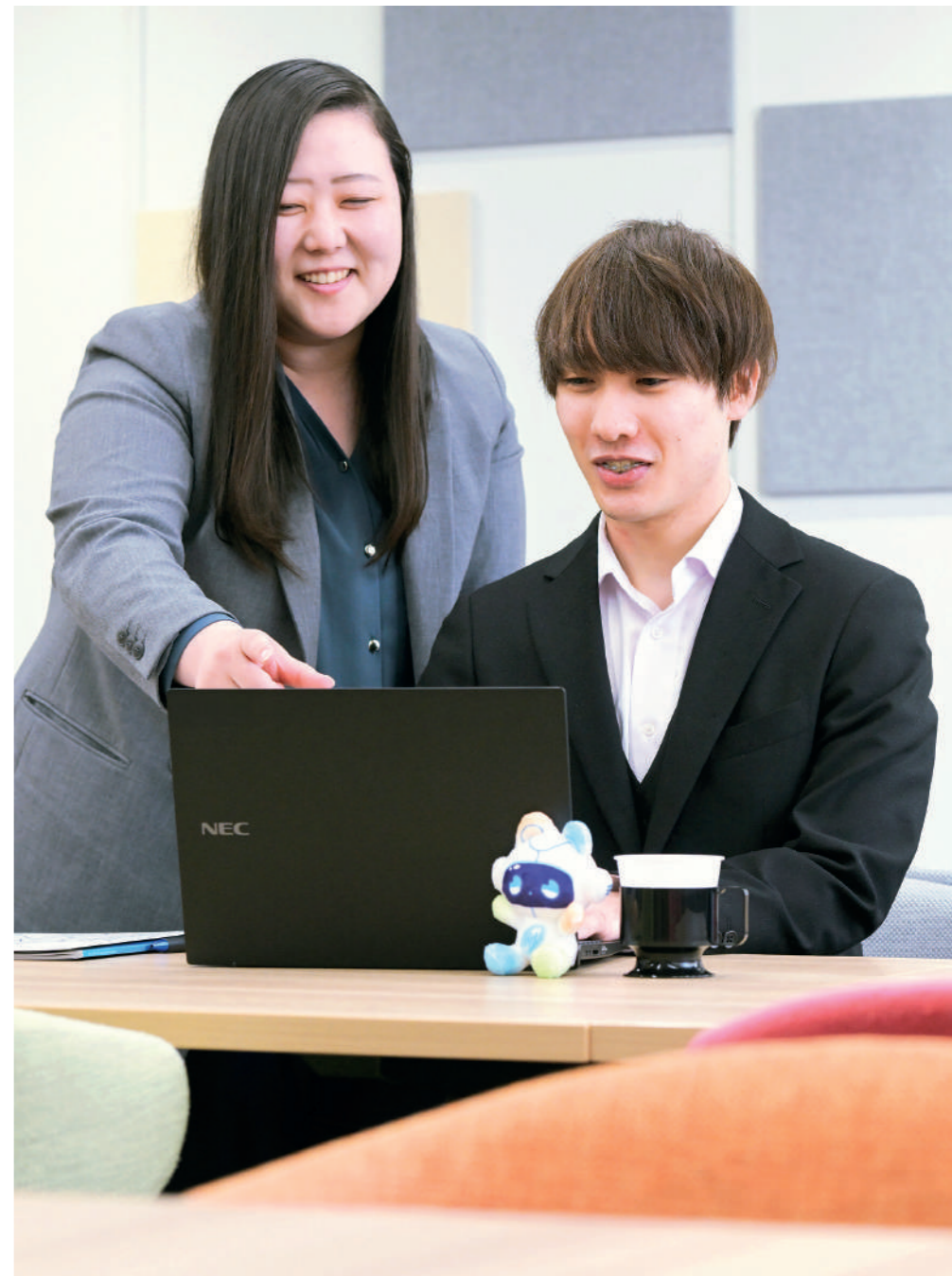
わからないことはすぐに聞ける、風通しのよい環境が成長を後押し。